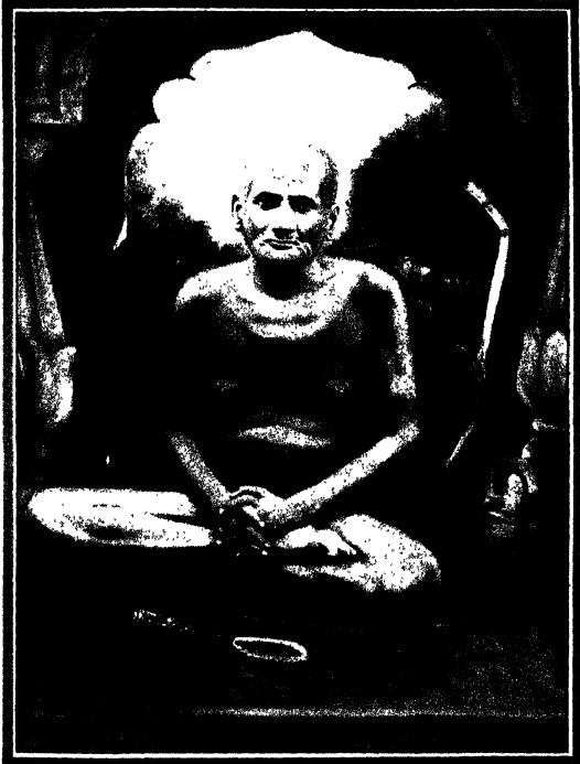
श्री १०८ शान्तीमागर महाराज

चारंग्यचक्रवर्ती ढिगचर जनाचार्य - (७) श्री शान्तीमागर महाराज